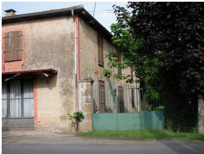
La « maison BRU » Futur Centre médico-social

C'est donc une affaire à suivre dont la bonne fin sera essentiellement dans les mains des intéressés.