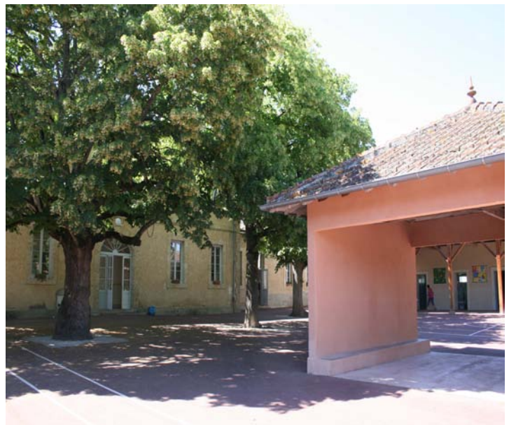
La cour à l'ombre des tilleuls