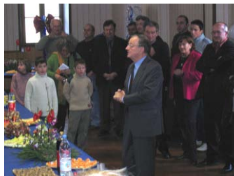
Les vœux à la mairie

Merci donc de faire de cette feuille, un instrument de dialogue et donc d'une entente et d'une compréhension renforcée entre tous les simorrains.